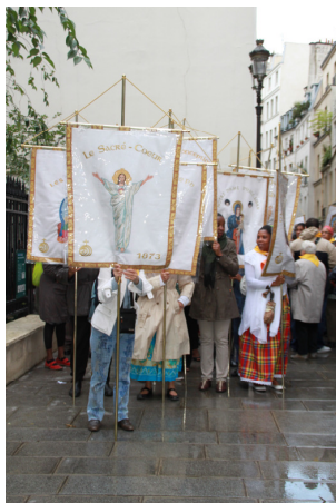
Pélé chantant dans les rues de Paris