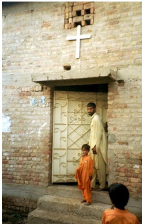
Église au Pakistan

Trois mois avant la visite de Benoît XVI (printemps 2012) le président Raul Castro a annoncé la libération de 2900 prisonniers. (Zenit)