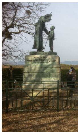
"Je te montrerai le chemin du ciel". Statue du saint Curé à Ars et du jeune berger, Antoine